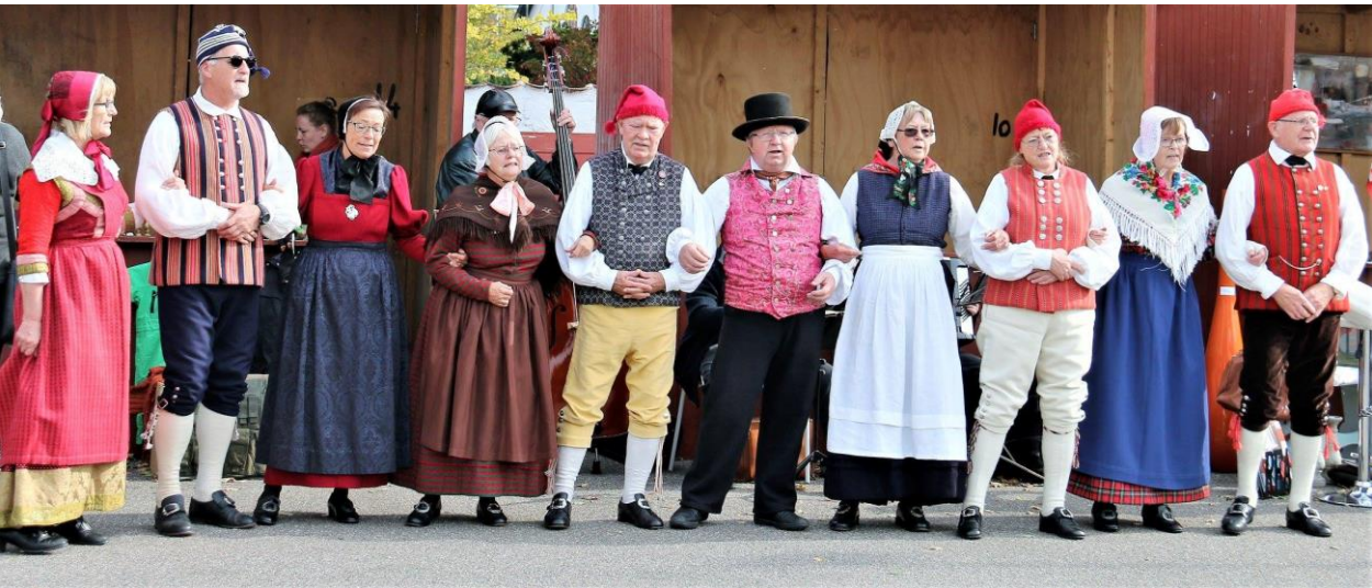
Middelaldermusik og folkedans på kirkepladsen var et farverigt syn