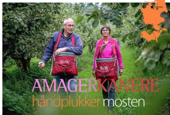
Det går raskt op og tæller ned mellem de tose æbler. De to æbler er kun 15 sekunder fra at være æbler.

Nordvestnyt dækkede vor Æblefestival på Tuse Næs fint. Her en forside og henvisning til artikel inde i bladet. By og Land valgte også at sætte Fokus på Tuse Næs.